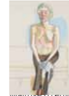
ALICE NEEL FONDATION VAN GOGH - ARLES

Maîtrise d'œuvre de la scénographie Suivi et coordination du chantier