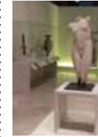
MYTHES FONDATEURS D'HERCULE À DARK VADOR MUSÉE GALLO-ROMAIN - SAINT-ROMAIN-EN-GAL (VIENNE)

Mission Scénographie de l'exposition Graphisme et signalétique Gestion et suivi du chantier