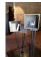
GERMAINE TILLION LES ARMES DE L'ESPRIT MUSÉE DE LA RÉSISTANCE ET DE LA DÉPORTATION - CITADELLE DE BESANÇON

Maîtrise d'œuvre de la scénographie Suivi et coordination du chantier