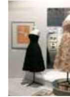
CHRISTIAN DIOR, ESPRIT DE PARFUMS MUSÉE INTERNATIONAL DE LA PARFUMERIE - GRASSE

Mission Scénographie de l'exposition Graphisme et signalétique Gestion et suivi du chantier