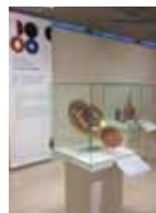
LE DESIGN A 2000 ANS LES GRANDES FABRIQUES DE LA GRAUFESENQUE À LIMOGES

MUSÉE GALLO-ROMAIN - SAINT-ROMAIN-EN-GAL (VIENNE)