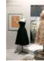
CHRISTIAN DIOR, ESPRIT DE PARFUMS MUSÉE INTERNATIONAL DE LA PARFUMERIE - GRASSE