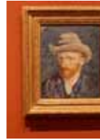
VAN GOGH LA TRADITION MODERNISÉE FONDATION VAN GOGH - ARLES