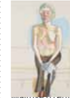
ALICE NEEL FONDATION VAN GOGH - ARLES

Maîtrise d'œuvre de la scénographie Suivi et coordination du chantier