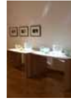
UNE MAISON DE VERRE LES 30 ANS DU CIRVA AU MUSÉE CANTINI MUSÉE CANTINI - MARSEILLE

Mission Scénographie de l'exposition Identité graphique Signalétique Gestion et suivi du chantier