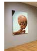
GLENN BROWN FONDATION VAN GOGH - ARLES

Mission Maîtrise d'œuvre scénographique globale