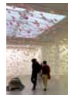
« MON CHER... » URS FISHER FONDATION VAN GOGH - ARLES

Thématiques Exposition d'art contemporain et installation plasticienne