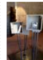
GERMAINE TILLION LES ARMES DE L'ESPRIT

MUSÉE DE LA RÉSISTANCE ET DE LA DÉPORTATION - CITADELLE DE BESANÇON