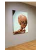
GLENN BROWN FONDATION VAN GOGH - ARLES