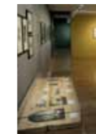
VINCENT VAN GOGH FONDATION VAN GOGH - ARLES

Mission Conception du parcours aux côtés du commissaire d'exposition Lay-out en lien avec le commissaire d'exposition Construction des nouvelles cimaises d'accrochage Mise en peinture, et montage du chantier